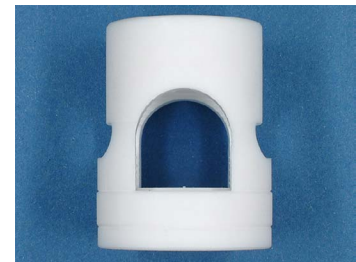
Pour détecteur M30 - tuyau 3/4", PTFE