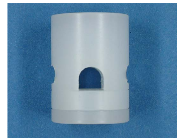
Pour détecteur M30 - tuyau D 5.0, Nylon