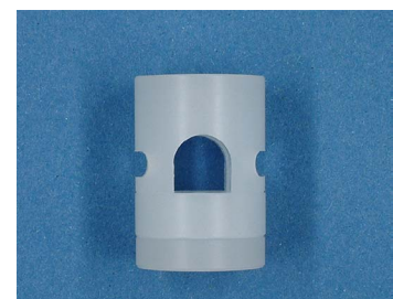
Pour détecteur M18 - tuyau D.6.5, Nylon

Sous réserve de modification des caractéristiques sans préavis. (05-08-2005)